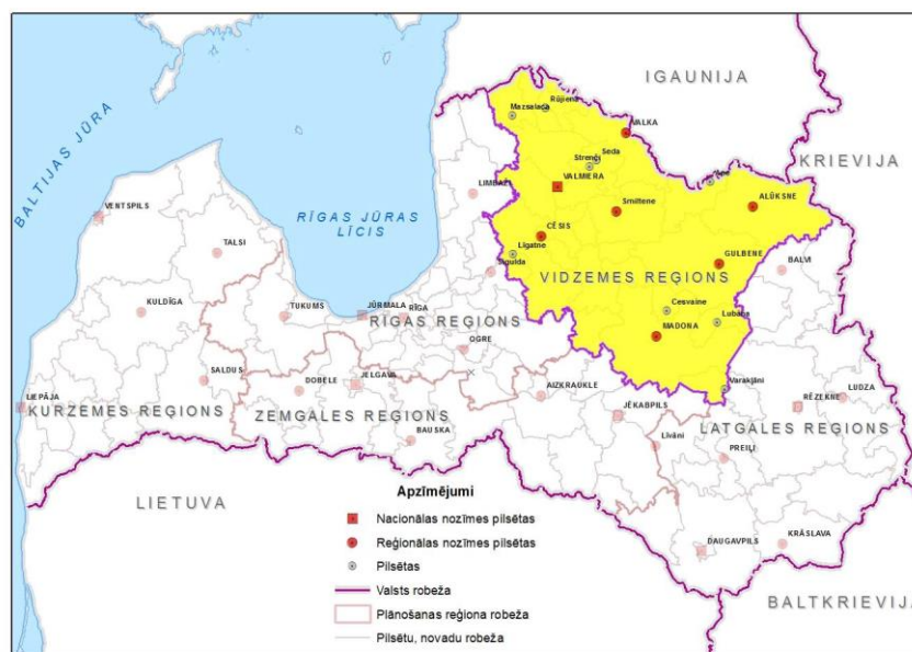
1.attēls. Plānošanas reģionu izvietojums Latvijas teritorijā

Reģionā ietilpst 26 pašvaldības: viena republikas nozīmes pilsēta – Valmiera un 25 novadi – Alūksnes, Amatas, Apes, Beverīnas, Burtnieku, Cesvaines, Cēsu, Ērgļu, Gulbenes, Jaunpiebalgas, Kocēnu, Līgatnes, Lubānas, Madonas, Mazsalacas, Naukšēnu, Pārgaujas, Priekuļu, Raunas, Rūjienas, Smiltenes, Strenču, Valkas, Varakļānu un Vecpiebalgas.