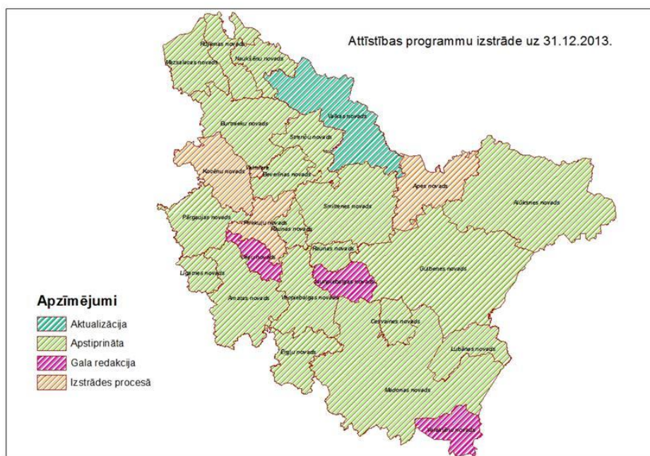
2.attēls „Attīstības programmu izstrāde uz 31.12.2013.”

Jāpiezīmē gan, ka Saeima ir atbalstījusi izteiktos priekšlikumus par pašvaldību ilgtspējīgas attīstības stratēģiju izstrādes termiņa pagarināšanu, un 2014.gada 12.martā ir stājies spēkā Teritorijas attīstības plānošanas likums ar grozījumiem, kur noteikts, ka: „Vietējās pašvaldības un plānošanas reģioni līdz 2014.gada 31.decembrim nodrošina ilgtspējīgas attīstības stratēģiju un attīstības programmu izstrādi vai aktualizāciju saskaņā ar šo likumu.”.