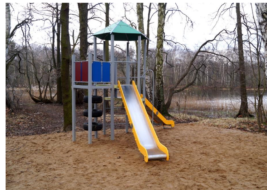
Fotogrāfijas no Gdaņskas pilsētas Līdzdalības budžeta rezultātiem (Prezentēti Providus konferencē 2019.gada novembrī)