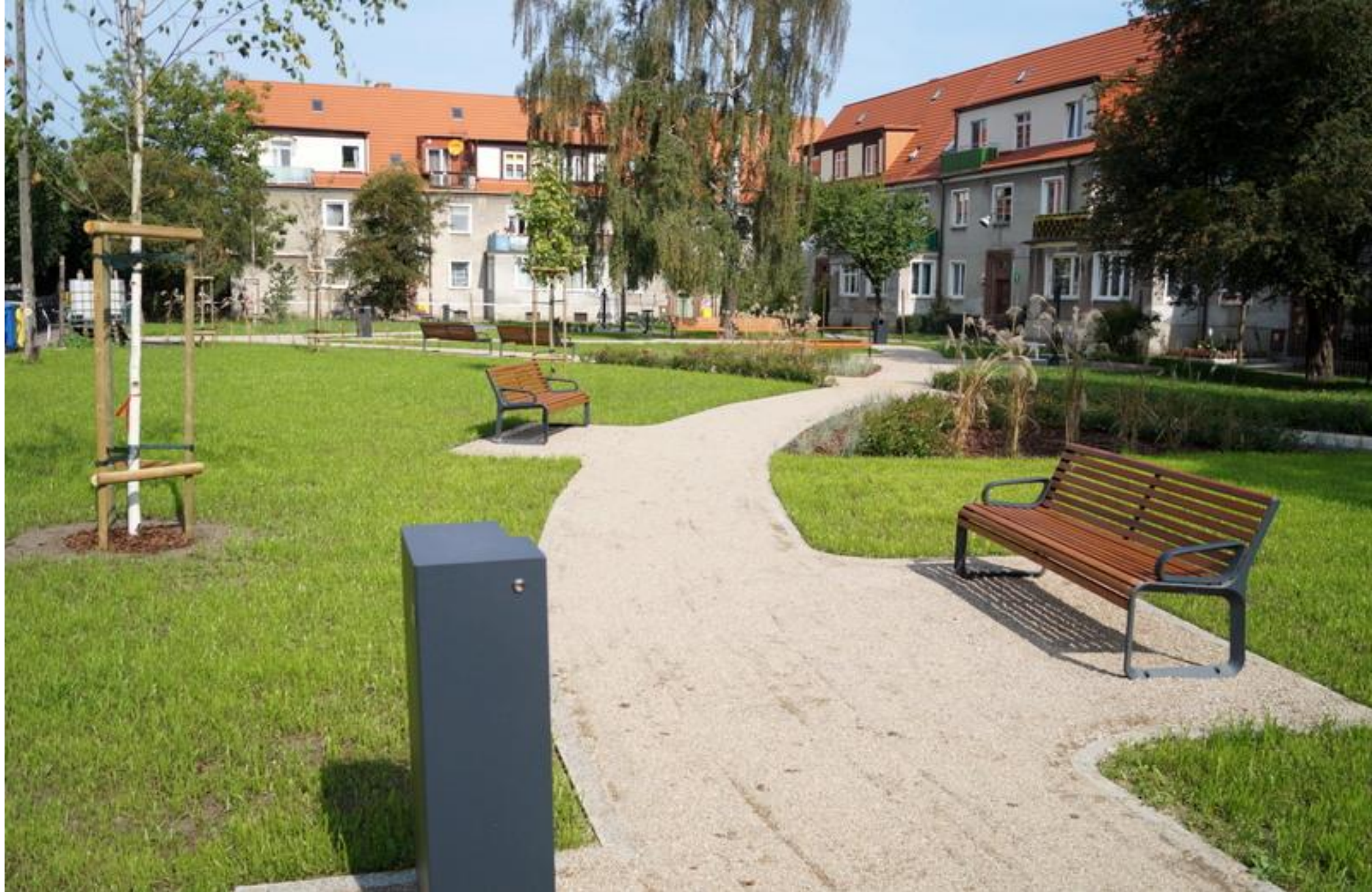
Fotogrāfijas no Gdaņskas pilsētas Līdzdalības budžeta rezultātiem (Prezentēti Providus konferencē 2019.gada novembrī)