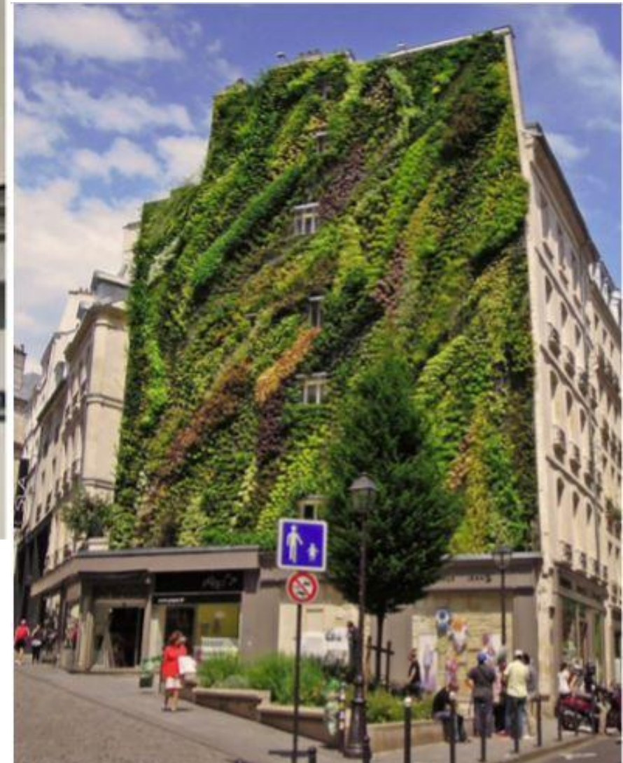
Foto no informatīvā materiāla par Līdzdalības budžetu Parīzes pašvaldībā ( https://budgetparticipatif.paris.fr/bp/plugins/download/PB_in_Paris.pdf )