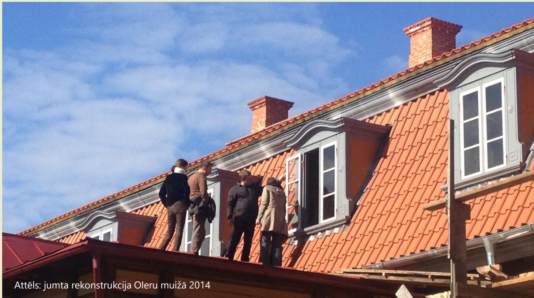
Attēls: jumta rekonstrukcija Oleru muižā 2014