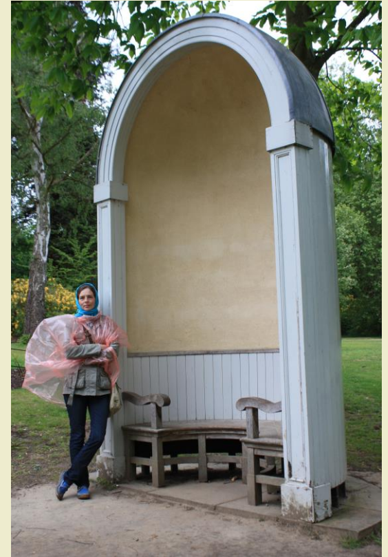
Attēls: Kjū dārzs (Kew) un Klaremont ainavu dārzs (Claremont)