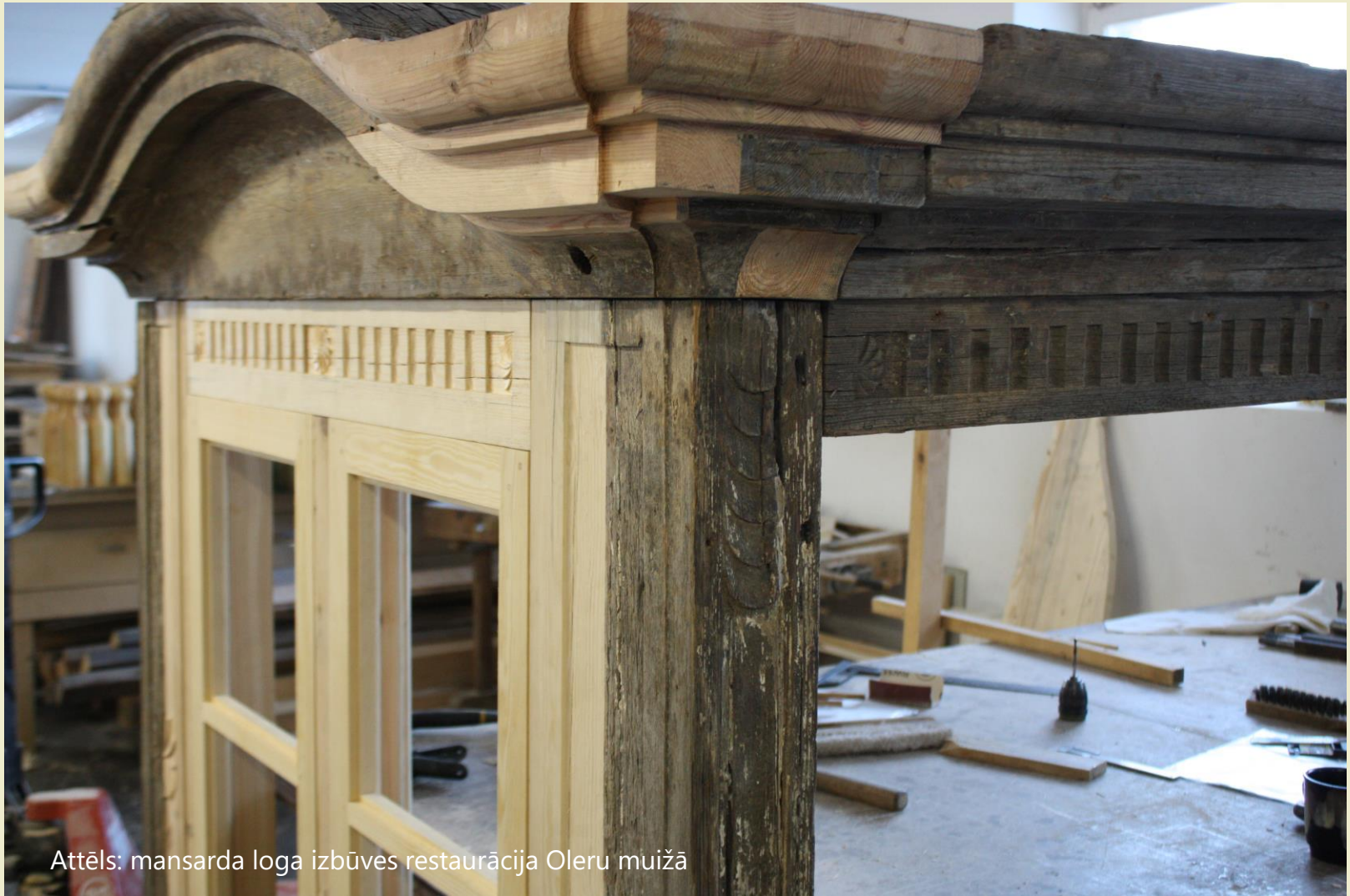
Attēls: mansarda loga izbūves restaurācija Oleru muižā