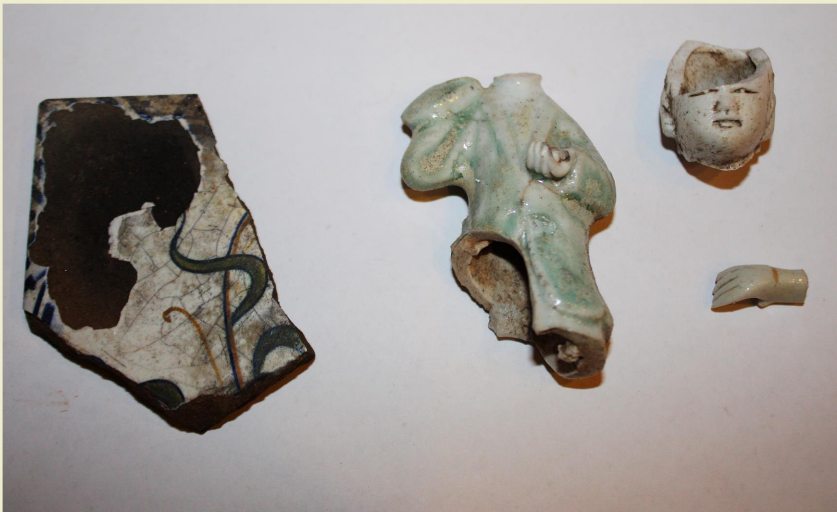
Attēls: izrakumi Oleru muižas dārzā