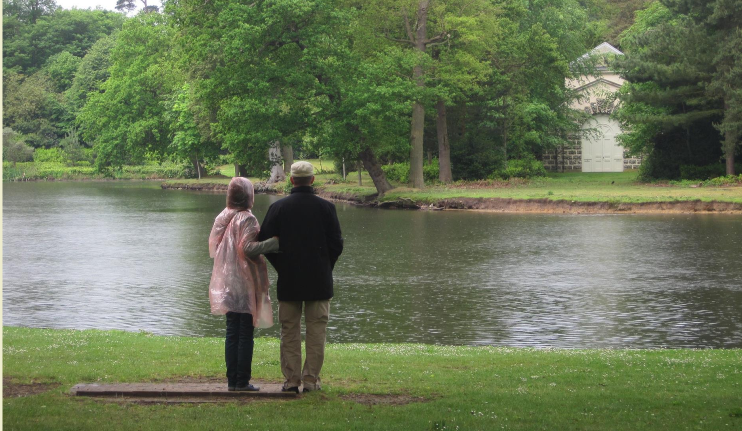
Attēls: Klaremont ainavu dārzs