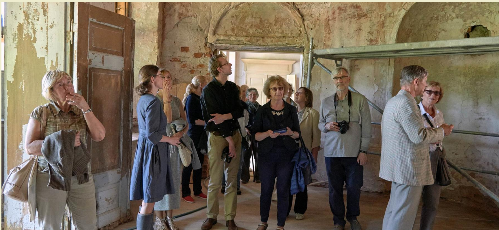
Attēls: zinātniskās konferences “Vidzemes bruņniecība un Latvija” dalībnieku vizīte Oleru muižā 2016