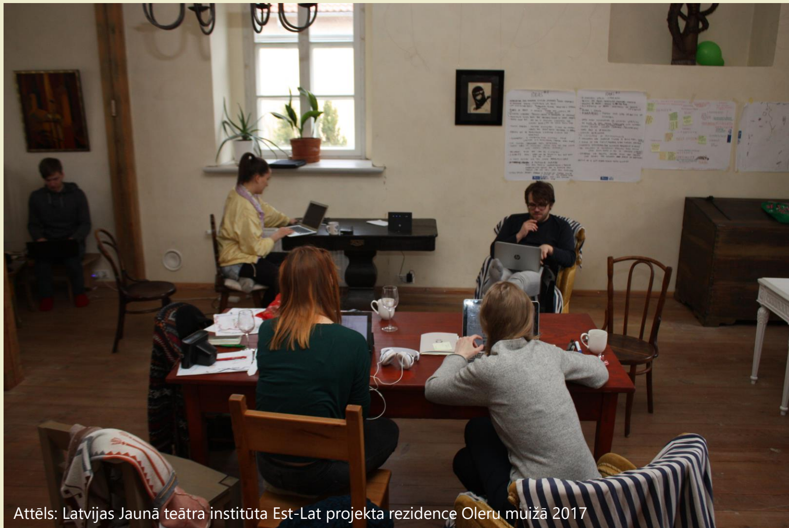
Attēls: Latvijas Jaunā teātra institūta Est-Lat projekta rezidence Oleru muižā 2017