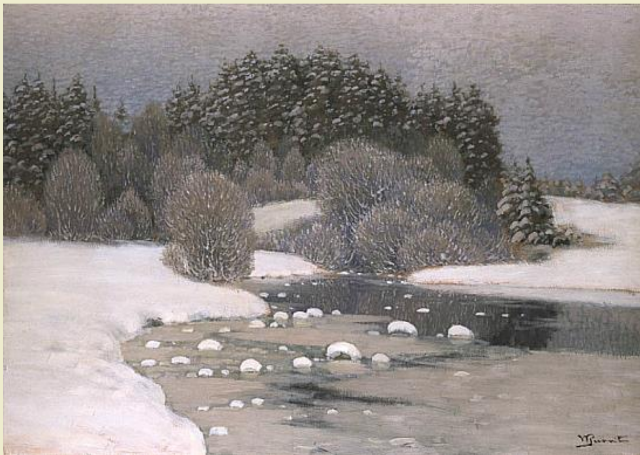
Vilhelms Purvītis, glezna "Ziema" (1910)