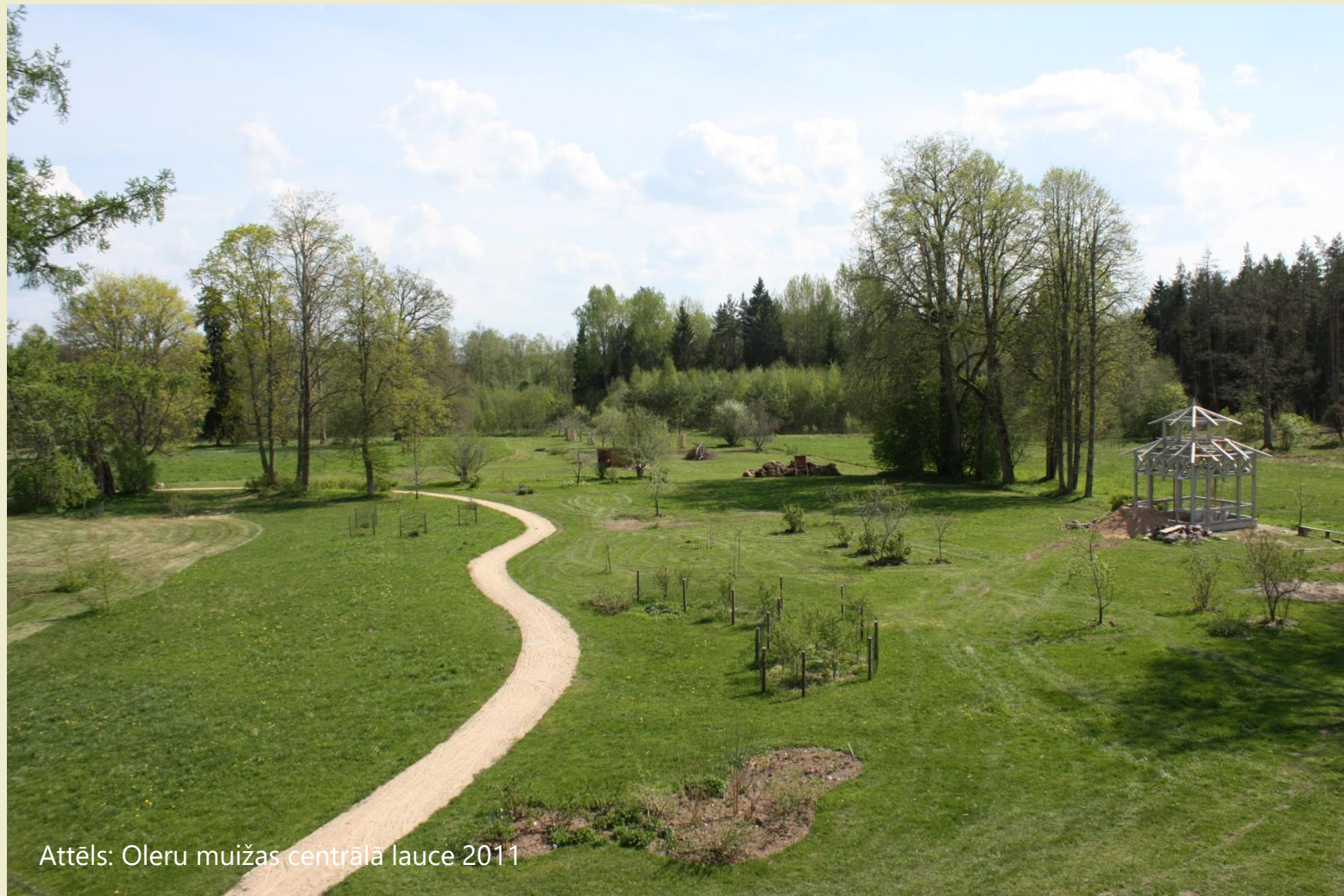
Attēls: Oleru muižas centrālā lauce 2011