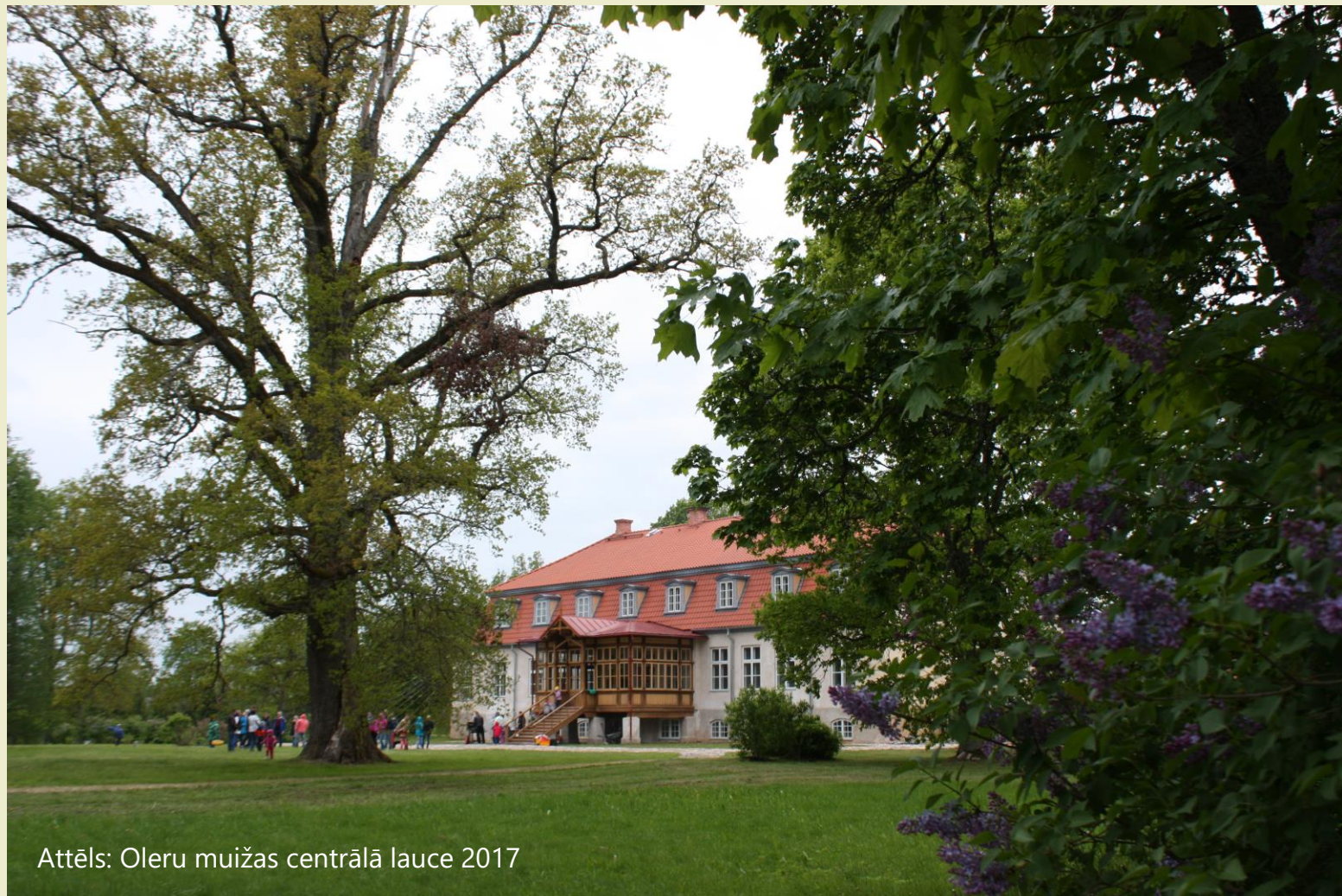
Attēls: Oleru muižas centrālā lauce 2017