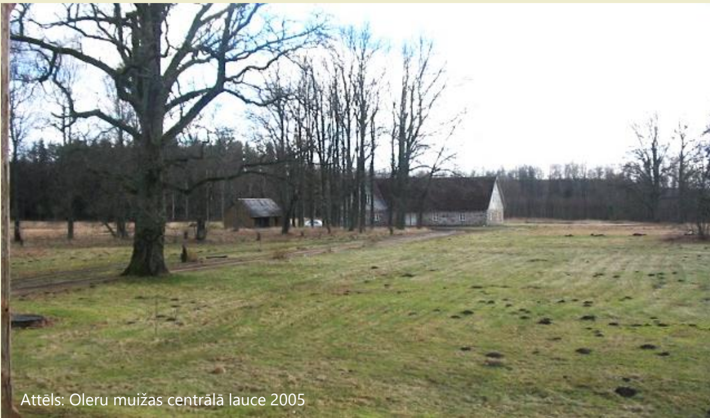
Attēls: Oleru muižas centrālā lauce 2005