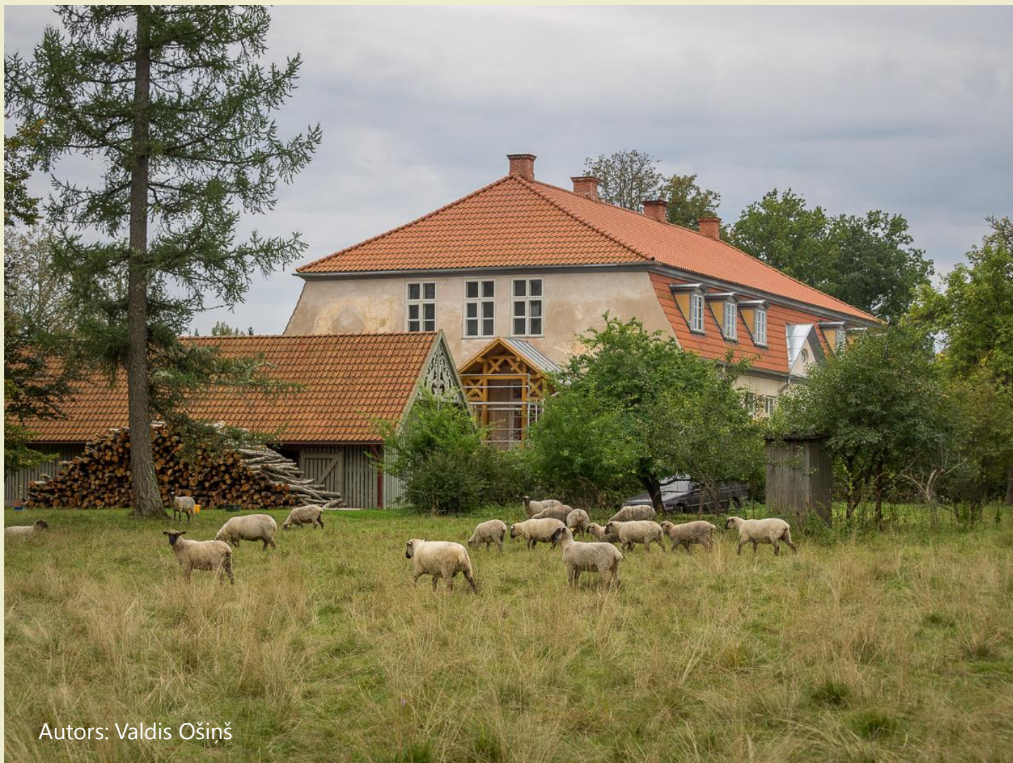
Autors: Valdis Ošiņš