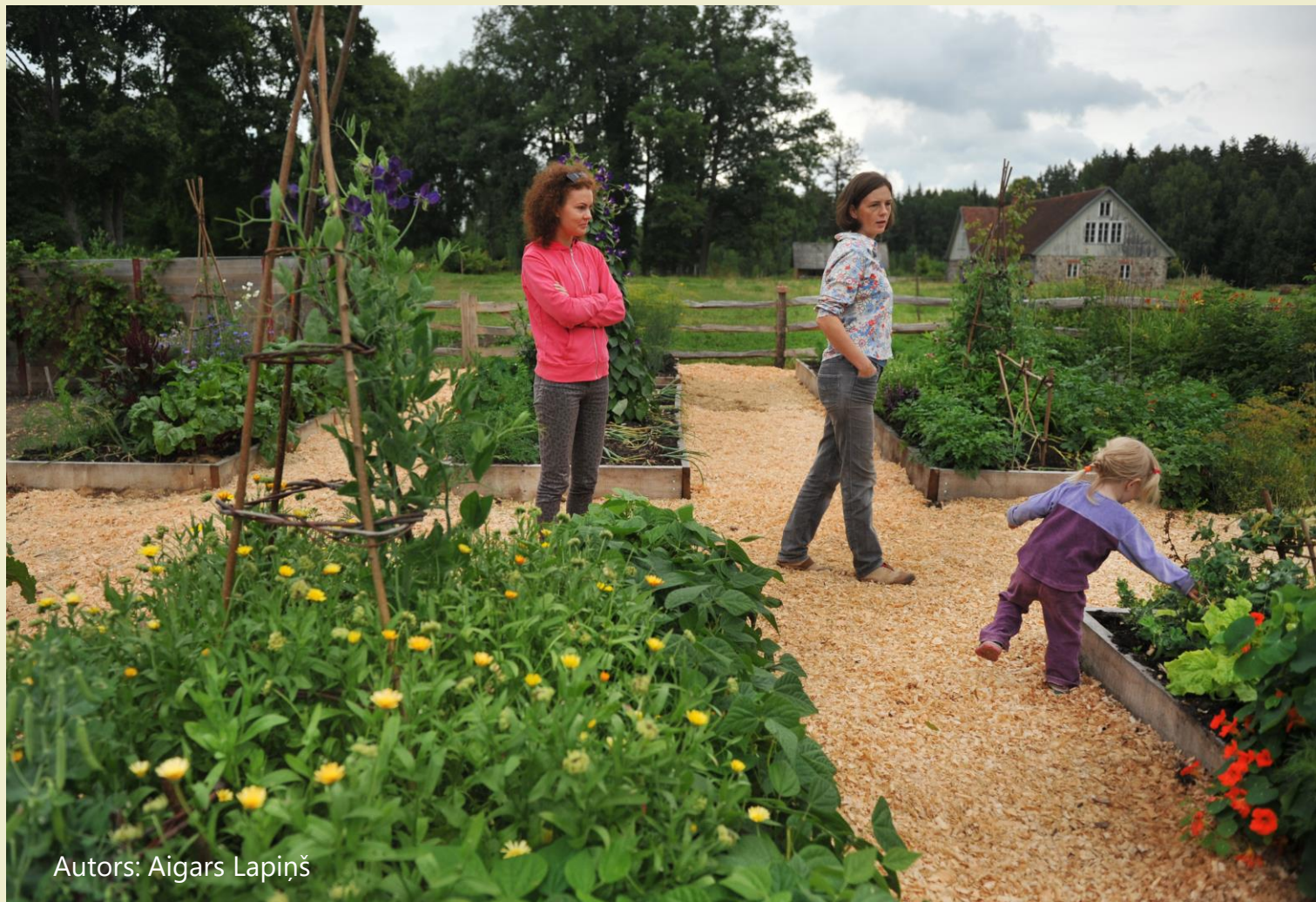
Autors: Aigars Lapiņš