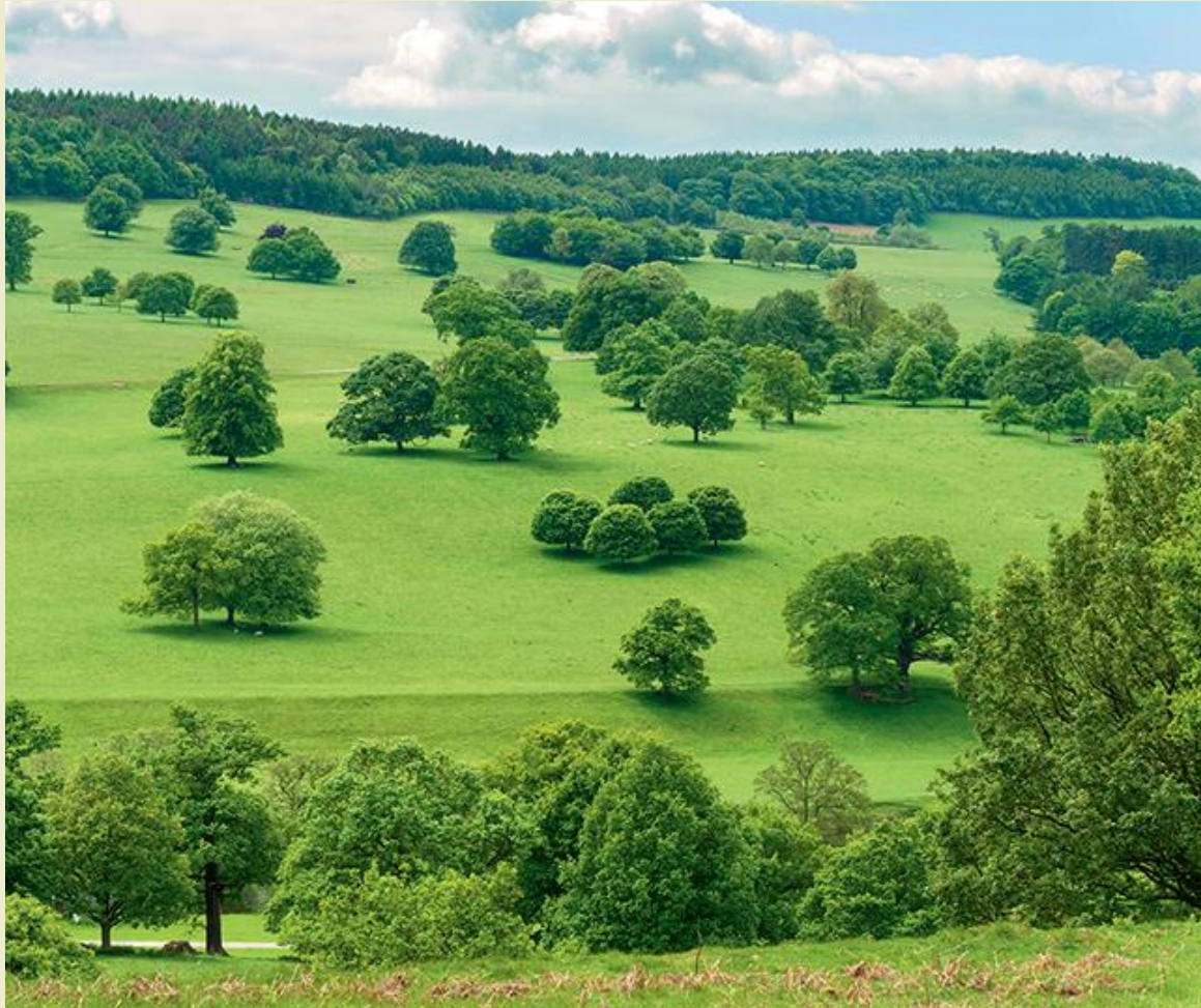
Lanselota Brauna projektētā ainava Chatsworth