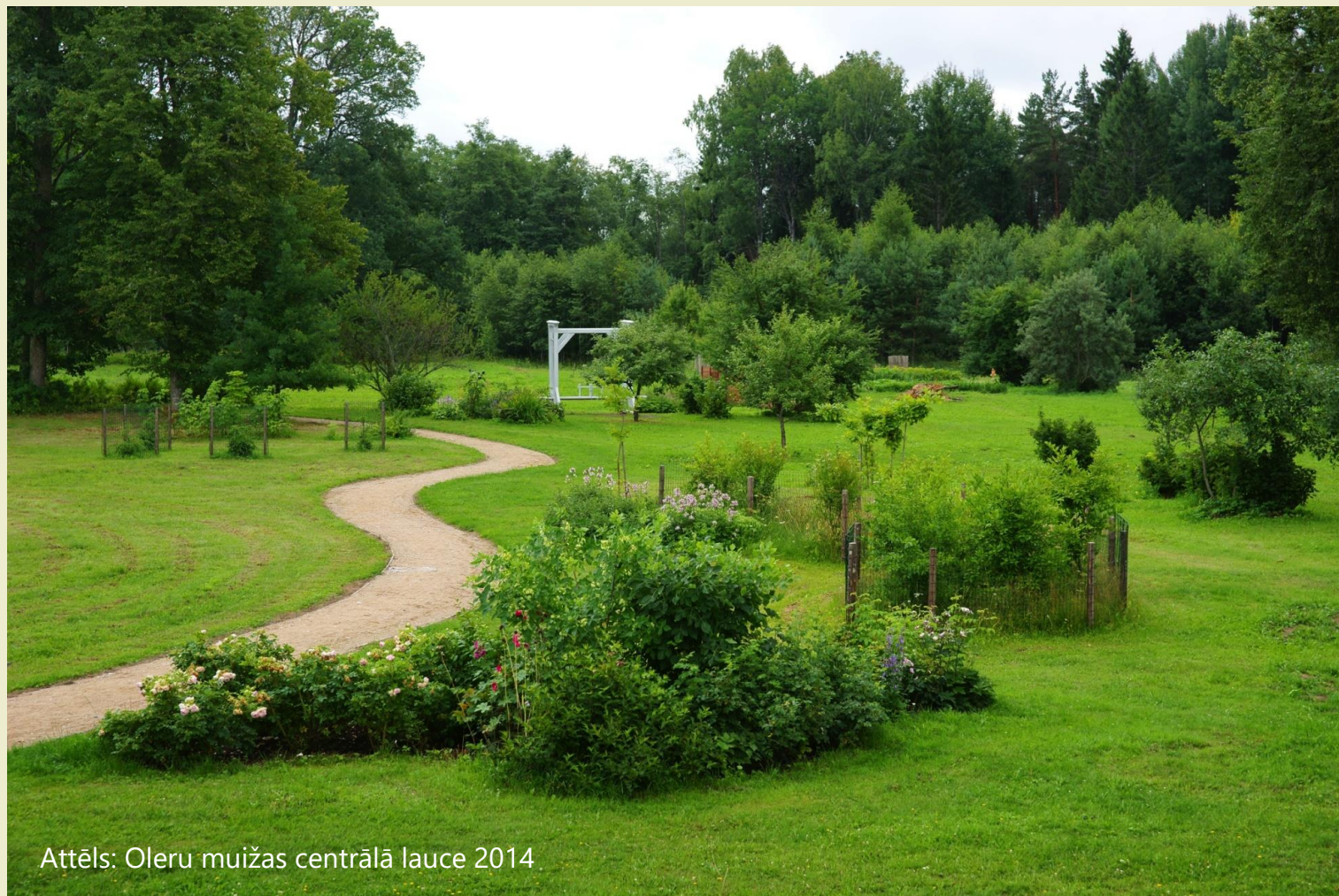
Attēls: Oleru muižas centrālā lauce 2014