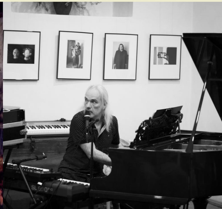
Attēls: kamermūzikas koncerti un izstādes Oleru muižā