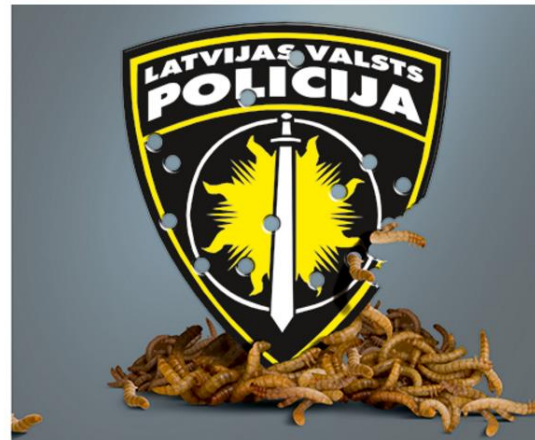
Ilustrācija — Krišs Salmanis

Atbilstoši 2014. gada 30. janvāra likuma 24. panta pirmās daļas 13. punkta